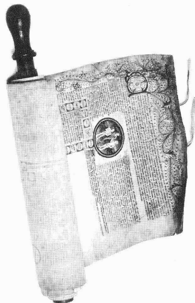
Boekrol, bevattende de wereldgeschiedenis, gevolgd door overzicht van genealogie en geschiedenis van Koningen van Engeland tot 1461. Engeland, 1461. (Kopenhagen, Det Kongelige Bibliotek, Ny Kgl. S. 1858 2 o ).

MOSTERT Marco (Ed.) Organizing the written word: scripts, manuscripts and texts. Proceedings of the first Utrecht Symposium on Medieval Literacy, Utrecht 5-7 June 1997 (= Utrecht studies in medieval literacy, 2) . Turnhout: Brepols: 2000. Ca. 384 pp, ill., geb. ISBN 2 5035 0765 4 € 65.